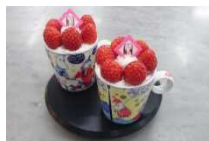
毎のパロア 各 ¥550(税込)