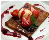
赤レンガ倉庫限定 とちおとめと赤いフルーツのクレープ ¥880(税込)