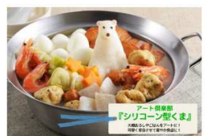
クマのデコ鍋トッピング