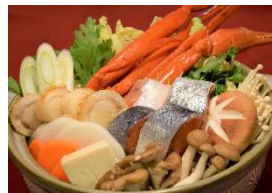
自分で作るこだわり鍋(石狩鍋セット)