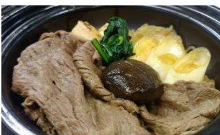
個性豊かなえらべる鍋 【浅草今半】監修 47牛鍋