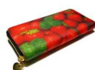
ストロベリーのラウンド長財布 ¥6,480(税込)