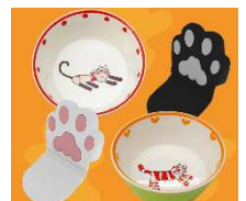
数量限定 肉球鍋つかみ 各¥972(税込) ブチボウル 各¥648(税込)