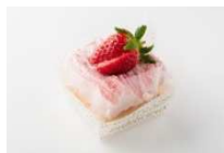
恋するモンブラン ¥600(税込)