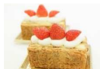
毎のミルフィーユ 各 ¥540(税込)