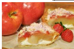
赤レンガ倉庫限定・数量限定・テイクアウトのみ ふくはる香の毎ミルクアップルパイ ¥486(税込) ※カット販売のみ

【ふくはる香 コラボ商品】 グラニースミス アップルパイ アンド コーヒー (2号館1階)