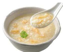
赤レンガ倉庫限定・数量限定 帆立の粥鍋(シウマイ2個付) ¥900(税込)