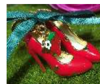
赤レンガ倉庫限定・数量限定 ストロベリーヒールチャーム ¥2,700(税込)