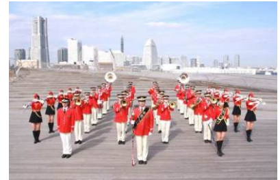
<横浜市消防音楽隊>

「ポートエンジェルス 1 1 9」は 1982 年に創設され、今年で 34 年目を迎えました。ストレートトランペットを駆使した“華麗で優雅、躍動感あふれるドリル演技”は横浜市民を始め、多くの皆さんから熱い声援をいただいています。