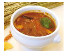
グーラッシュ ¥800(税込)

柔らかい牛サーロインを使用。肉本来の旨みと、ほどよい脂の甘みが絶妙にマッチした逸品。ドイツ版牛カツです。