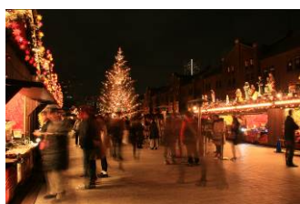
メインツリーとヒュッテ(昨年写真)