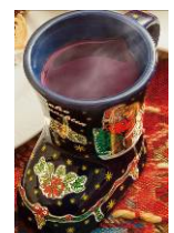
グリューワイン(ホットワイン) ¥700(税込)

熱々のホットチョコレートをかけた4cm角の特大マシュマロが初登場。食べ歩きをしながら、クリスマスマーケットをお楽しみいただけます。