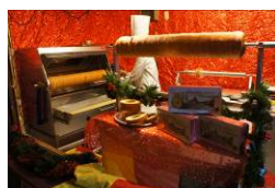
出来立てバウムクーヘン ¥700(税込)

ヒュッテで焼き上げるバウムクーヘンは出来立ての温かいものをご提供。今年はさらに、チョコやジャムなどをトッピングできます。