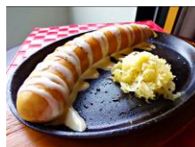
カイザーケーゼブルスト ¥800(税込)

穏やかに燻製を施した 180g の特大ソーセージにチェダーチーズを添えて濃厚な味わいに仕上げました。