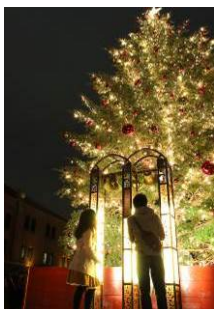
10m のモミの木ツリーとカップルで囁らすと幸せになると言われている幸せの鐘(昨年写真)