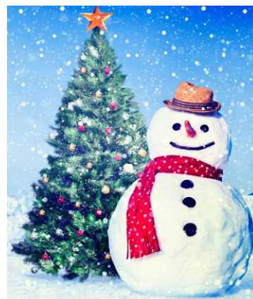
<雪だるまの点灯スイッチイメージ>

横浜赤レンガ倉庫では、11月26日(土)から12月25日(日)までの計30日間、『クリスマスマーケット in 横浜赤レンガ倉庫』を横浜赤レンガ倉庫イベント広場で開催します。開催前日の11月25日(金)17時30分より、 横浜市消防音楽隊によるパフォーマンスと、雪だるまの点灯スイッチが会場に灯りをともすライトアップセレモニー を行います。