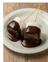
ホットチョコレートがけ特大マシュマロ ¥500(税込)

ヒュッテで焼き上げるバウムクーヘンは出来立ての温かいものをご提供。今年はさらに、チョコやジャムなどをトッピングできます。