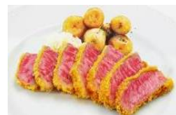
シュニッツェル(牛サーロインカツレツ) ¥1400(税込)

穏やかに燻製を施した 180g の特大ソーセージにチェダーチーズを添えて濃厚な味わいに仕上げました。