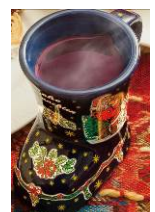
グリューワイン(ホットワイン) ¥700(税込)

熱々のホットチョコレートをかけた4cm角の特大マシュマロが初登場。食べ歩きをしながら、クリスマスマーケットをお楽しみいただけます。