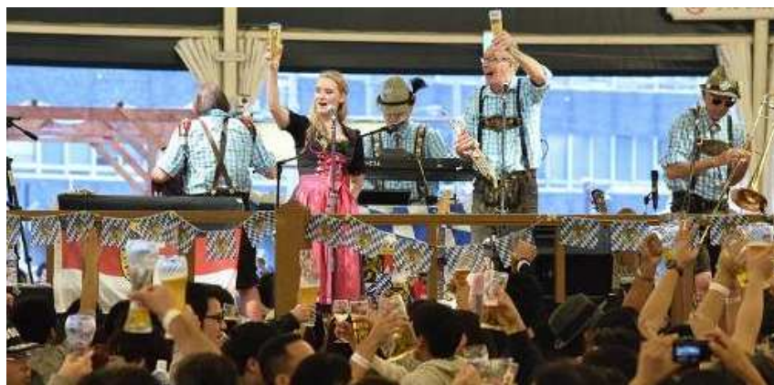
<昨年の写真：ドイツ楽団の音楽に合わせ盛り上がるメインテント内の様子>

オープニングセレモニー／9月30日（金）17：30～18：00（報道受付17：00～）