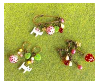
いちごの手づくりアクセサリ