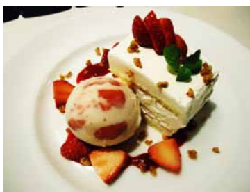
苺ケーキと苺アイスのマリージュ

内容：横浜赤レンガ倉庫内のレストランや物販店舗でもいちごにちなんだメニューやアイテムが販売します。