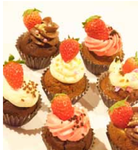
【イベント限定】いちごカップケーキ