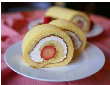
【初登場】いちごロールケーキ