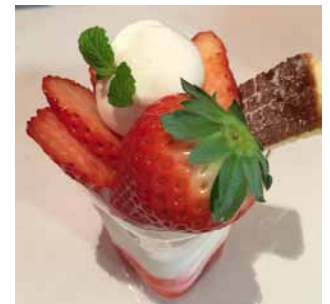
「スカイベリーのパフェ」イメージ

※2月6日（土）、2月7日（日）、2月13日（土）、2月14日（日）の土日限定、数量限定での販売となります。