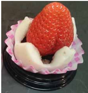
【イベント限定】スカイベリー大福