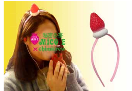
【イベント限定】いちごカチューシャ