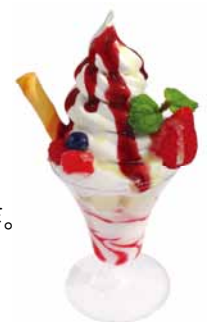
いちごパフェサンプルイメージ

横浜赤レンガ倉庫HP http://www.yokohama-akarenga.jp/