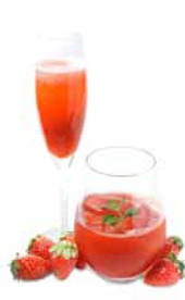
季節のフレッシュフルーツカクテル苺