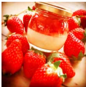
【初登場】プリン・ストロベリー