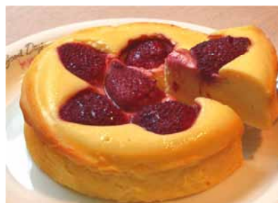
【初登場】いちごチーズケーキ

<一般のお客様のお問い合わせ先> 横浜赤レンガ倉庫2号館インフォメーション 電話：045-227-2002