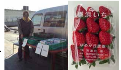
出張直売所イメージ

内容：横浜市内のいちご農家さんが横浜赤レンガ倉庫に出張直売所を設け、市内で生産されたいちごの販売を行います。「地産地消」による新鮮、とれたてのいちごをお楽しみください。