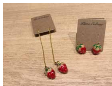
いちごピアス ショート&ロングタイプ