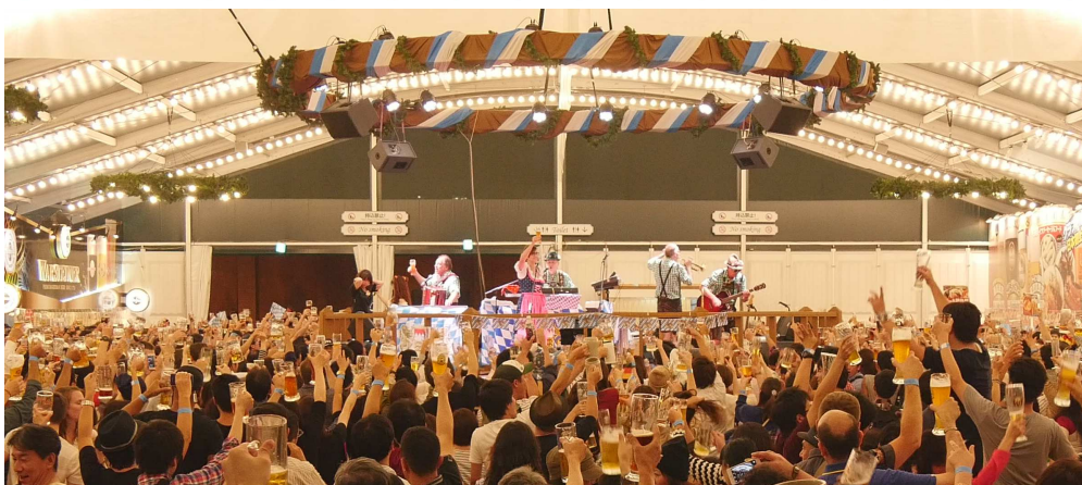
<昨年の写真:ドイツ楽団の音楽に合わせて盛り上がるメインテント内の様子>

オープニングセレモニー/10月2日(金)17:30~18:00 (報道受付17:00~)